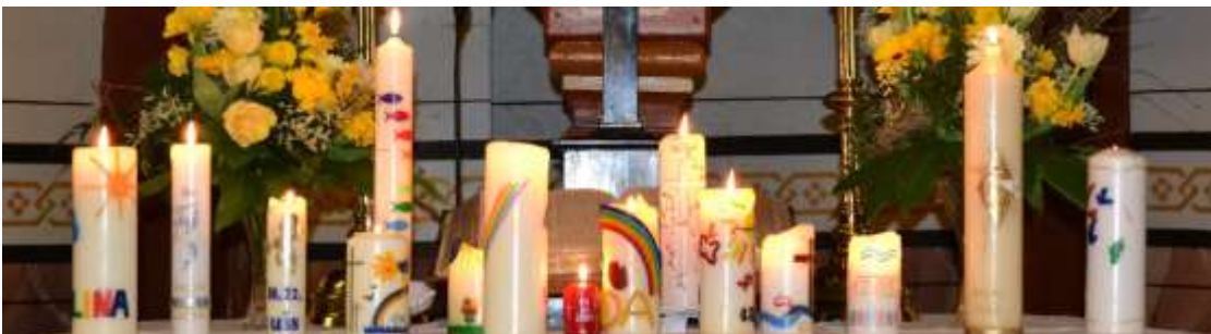
Foto: Taufferinnerungsgottesdienst Ostermontag 2016 in Kleinseelheim.

Wenn Sie Ihre Daten nicht im Gemeindebrief veröffentlicht haben möchten, geben Sie bitte rechtzeitig vor Redaktionsschluss im Pfarramt Bescheid. Danke! Ehejubiläen werden hier nicht aufgenommen.